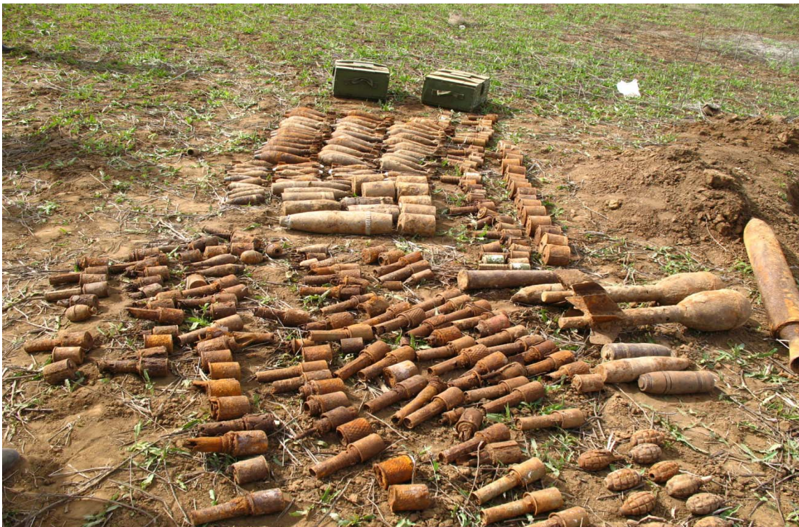
Боеприпасы, обнаруженные «черными копателями» на местах боев в Волгоградской области (лето 2009 г.)

Как показывает проведенный анализ, условиями, способствующими незаконному обороту охотничьего оружия, являются: