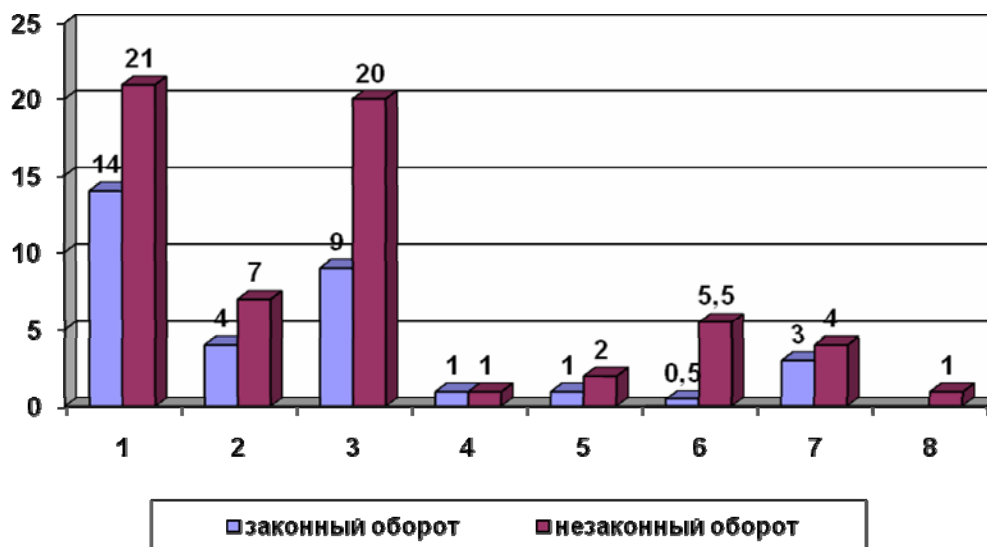
Рис. 3. Диаграмма распределения видов оружия, используемого при совершении преступлений: