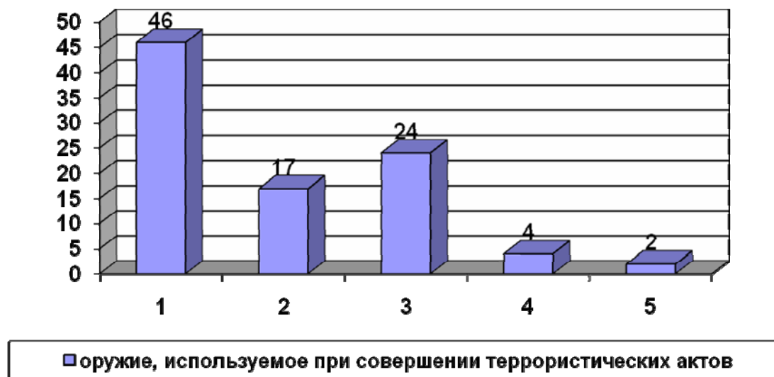
Рис. 1. Диаграмма распределения видов оружия, находящегося в законном обороте и используемого при совершении террористических актов: 1 – самодельные взрывные устройства; 2 – штатные боеприпасы взрывного действия (ручные и выстреливаемые гранаты); 3 – огнестрельное нарезное оружие; 4 – огнестрельное гладкоствольное оружие; 5 – холодное оружие